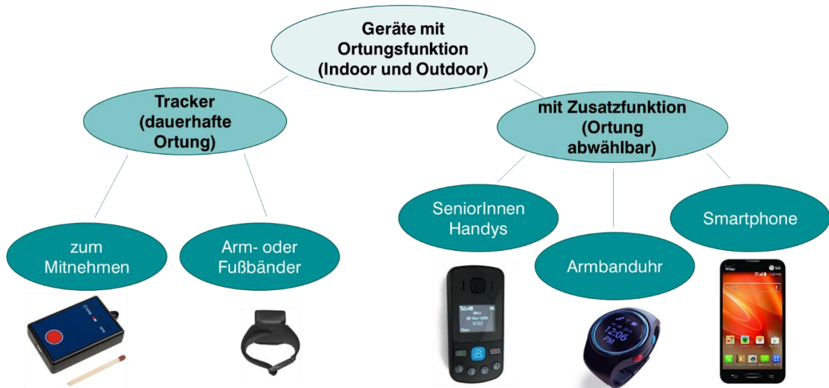
Abb.1: Assistive Technologien für Menschen mit Demenz oder pflegebedürftige Menschen

Derzeit gibt es bereits zahlreiche Produkte auf dem Markt, die speziell für Menschen mit Demenz entwickelt wurden. Die Produkte aus den Bereichen AAL und Smart Homes sollen der Zielgruppe ein möglichst langes selbstbestimmtes Leben in der vertrauten Wohnumgebung ermöglichen. Smart Home Entwicklungen (intelligente Technologiesysteme für zu Hause) versuchen dabei einzelne Produkte wie Smartphones, Tablets, Applikationen und verschiedene Sensoren zu vernetzen. Es werden Produkte zu Wohnen, Gesundheit, Sicherheit, Komfort und sozialer Interaktion angeboten. Die Produktpalette ist dementsprechend unübersichtlich und nur die wenigsten Produkte können miteinander kombiniert verwendet werden. In der u. a. Abbildung sind ein Teilbereich der Ortungsfunktionen und die verschiedensten Produktmöglichkeiten exemplarisch abgebildet. Sogar in einem Teilbereich, der so schmal wie dieser ist, wird die Vielfalt an Produktmöglichkeiten und die Funktionsbreite der angebotenen Technologien erkennbar.